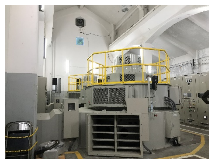
発電設備(第二発電所)