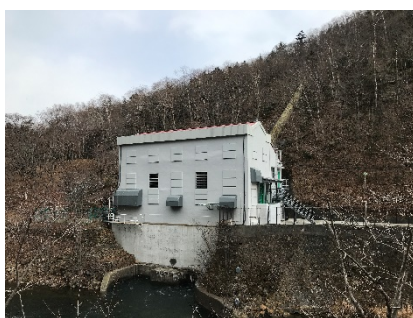
発電所建屋外観(第三発電所)